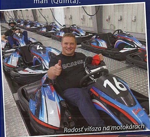
Radosť víťaza na motokárach

Osem najlepších z CO 2 N-TROL CUPU postupuje do národného finále Scania Driver Competitions, ktoré sa uskutoční na jar budúceho roku.